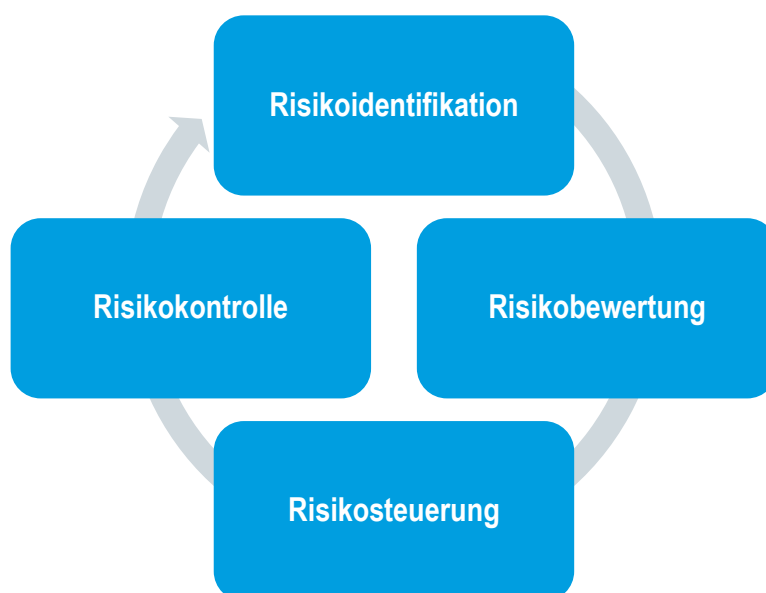
Abb 8 – Risikomanagementprozess

Das Risikomanagementsystem ist ein wesentlicher Teil des Governance-Systems der Barmenia. Eine wichtige Komponente des Risikomanagementsystems stellt der Risikomanagementprozess dar. Dieser ist der folgenden Abbildung zu entnehmen.