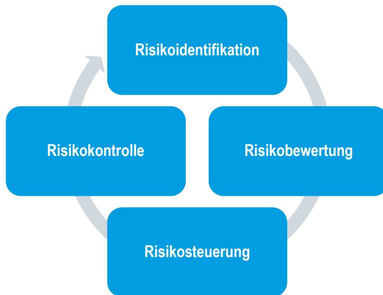
Abb 8 – Risikomanagementprozess

Das Risikomanagementsystem ist ein wesentlicher Teil des Governance-Systems der Barmenia. Eine wichtige Komponente des Risikomanagementsystems stellt der Risikomanagementprozess dar. Dieser ist der folgenden Abbildung zu entnehmen.