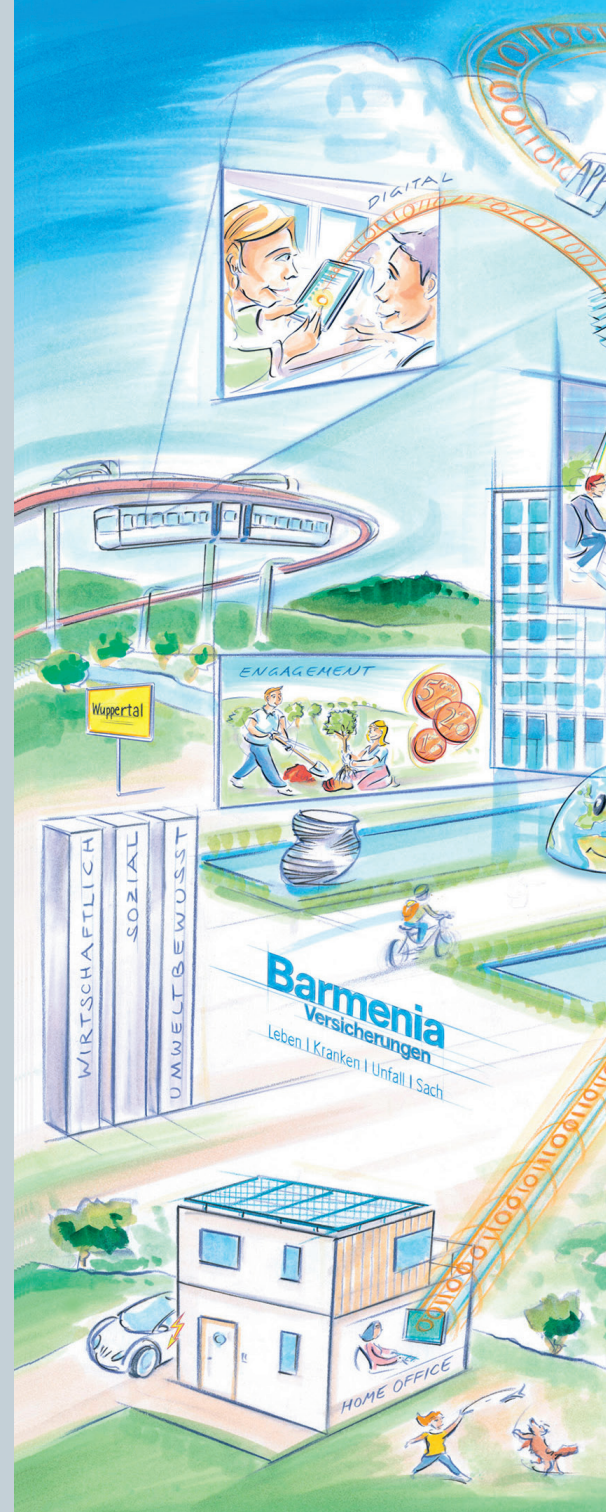
Abb. Visualisierung der Unternehmensverantwortung